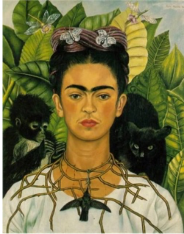
ZelfPortret Frida Khalo