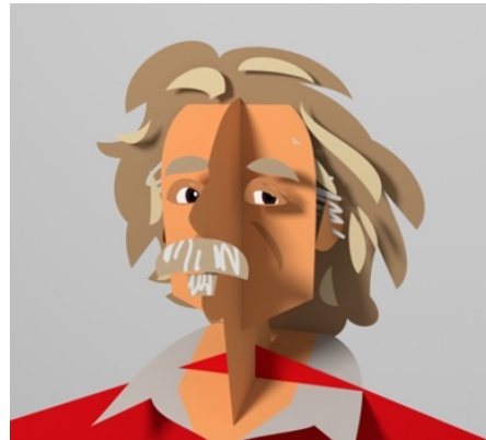
3d (ruimtelijk, niet getekend)